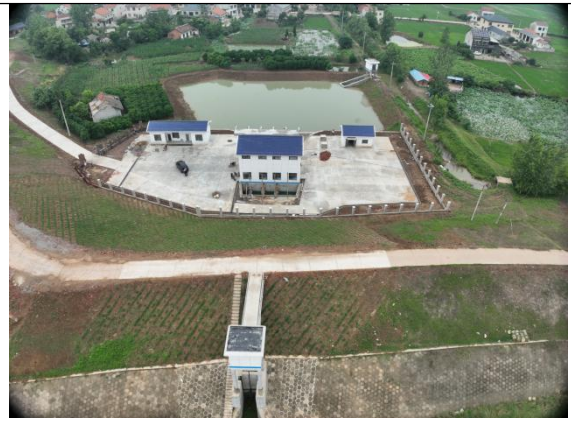
图8 澧县洞庭湖区重点区域排涝能力建设谭木堰泵站