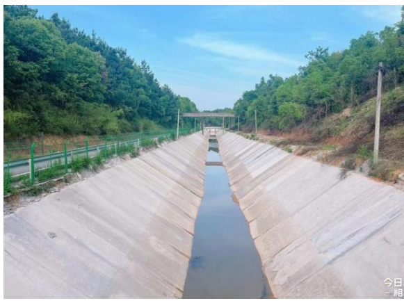
图5 岳阳县铁山灌区“十四五”续建配套与现代化改造