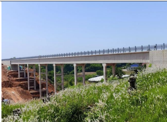
图7 桃源县黄石灌区“十四五”续建配套与现代化改造