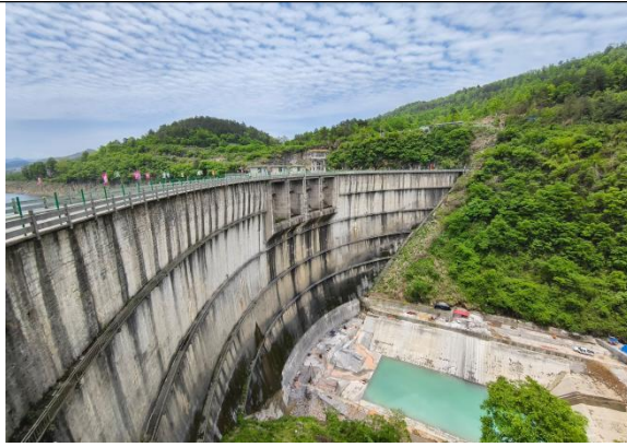
图9 凤凰县长潭岗水库除险加固