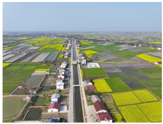
图6 汉寿县西湖灌区“十四五”续建配套与现代化改造