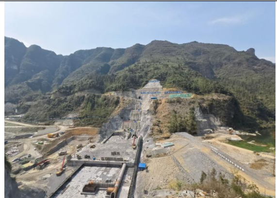
图10 湘西州大兴寨水库工程